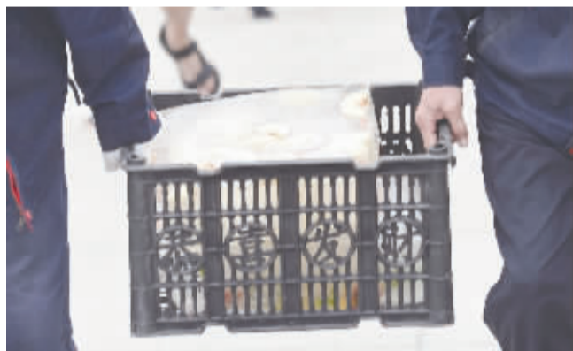
动植物公园工作人员为动物降温自制的大“冰棍”