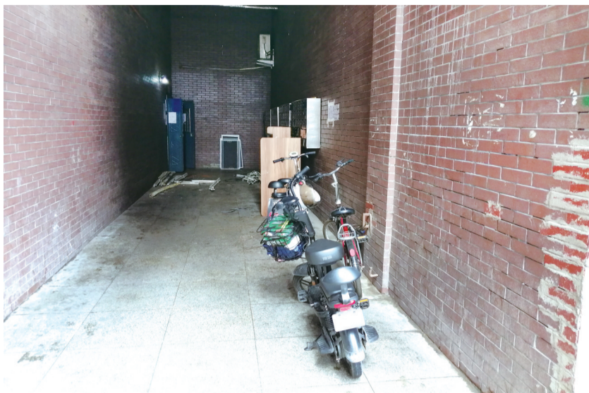
楼道口违规停放的电动自行车

动。“我们一个月前就贴了通知,并进行普法宣传,安排专人进行排查清理,现在通过小区微信群也进行了宣传,让居民了解安全要求,避免电瓶车违规停放。”另一个小区的物业人员则表示,《规定》实施前,物业特别设置了电瓶车停放区域,规范管理,给居民营造安全环境,引导居民主动自觉规范停放。