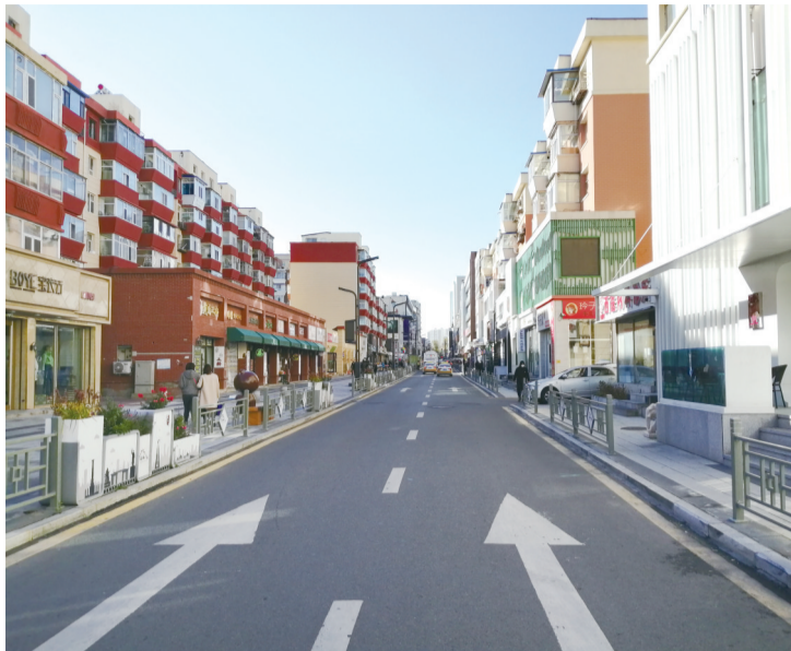
道路更加宽阔

“道路变宽了,老旧小区都铺了新的方砖,路边安装了休闲椅,增加了很多雕塑,出行更方便更舒适了,也更时尚了!”近日,经过长春市桂林路商圈的市民发现,桂林路商圈的一些设施、路面,包括景观都已经建设完毕,新景观带来的不仅仅是视觉的享受,也有实实在在的交通便捷和品质的提升。