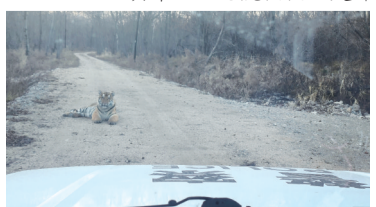
蹲在路边的东北虎不时和民警对视