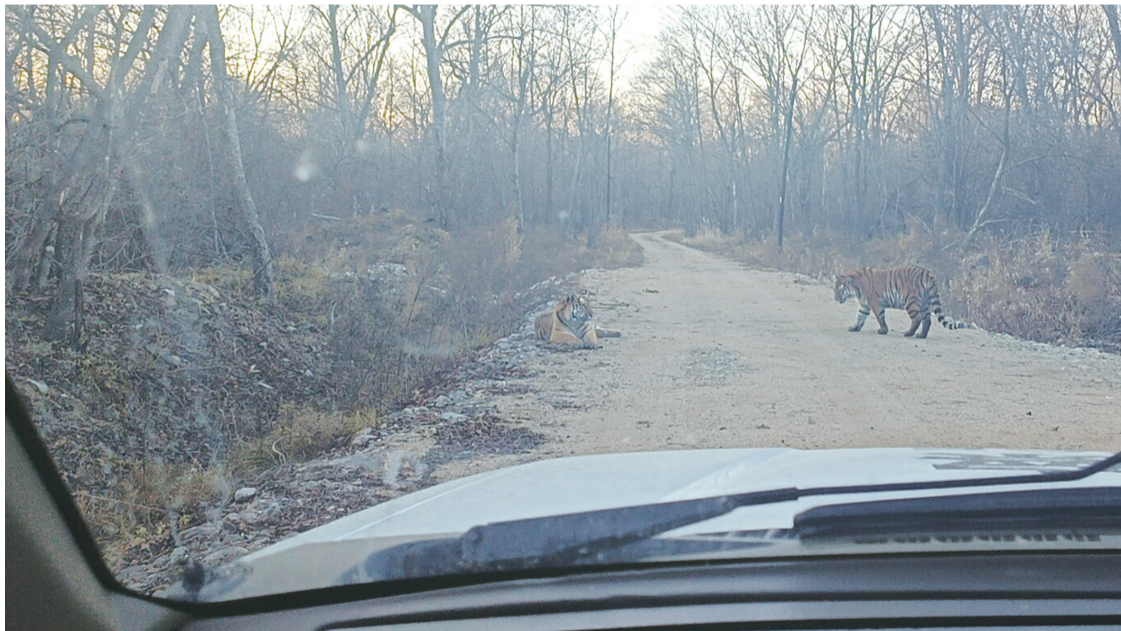
两只老虎一只蹲在路边休息,一只悠闲地漫步

10月25日,延边边境管理支队杨泡边境派出所民警在琿春市杨泡乡烟筒砬子东沟附近开展巡逻时,突然发现两只野生东北虎在路中出现,拦住车辆“不让通行”。