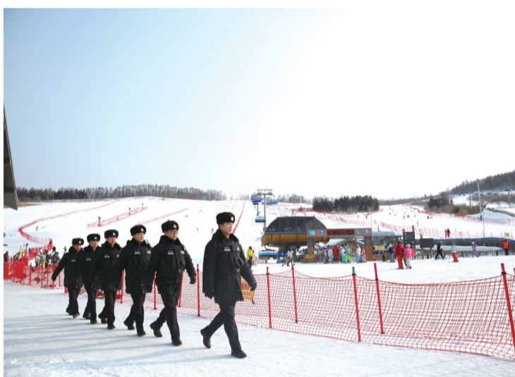
民警在景区开展治安巡逻

车助力下,成功从雪窝中驶出。经了解,该司机是长春市来长白山滑雪的游客,因盘山路弯大路滑,加之对此路况不熟,操作不当滑入路基之下,险些掉入几十米深的山谷,当时气温接近零下30摄氏度,幸遇巡逻民警得到及时救助。