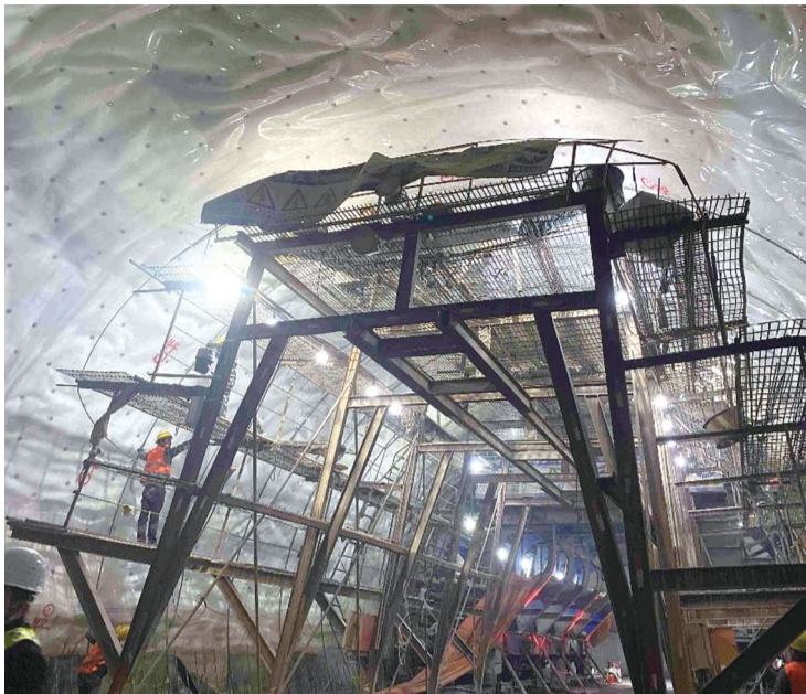
在建高速项目正在施工中