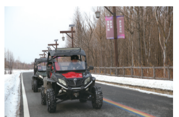
抚松边境管理大队民警驾驶越野车在景区开展治安巡逻

路基下积雪有半米多深,由于没有清雪工具,民警用腿和脚刨平了遇险车辆前方的积雪,并对车轮附近积雪进行了清理,后在民警推