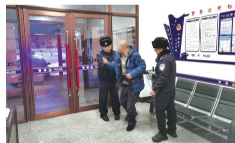
民警将男子带回派出所取暖

半小时后,男子逐渐恢复了意识,该男子自称酒后迷路,躺在地上睡着了。幸亏民警发现得及时,如果男