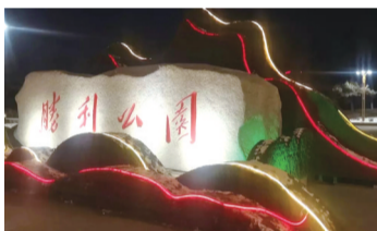
长春胜利公园亮化