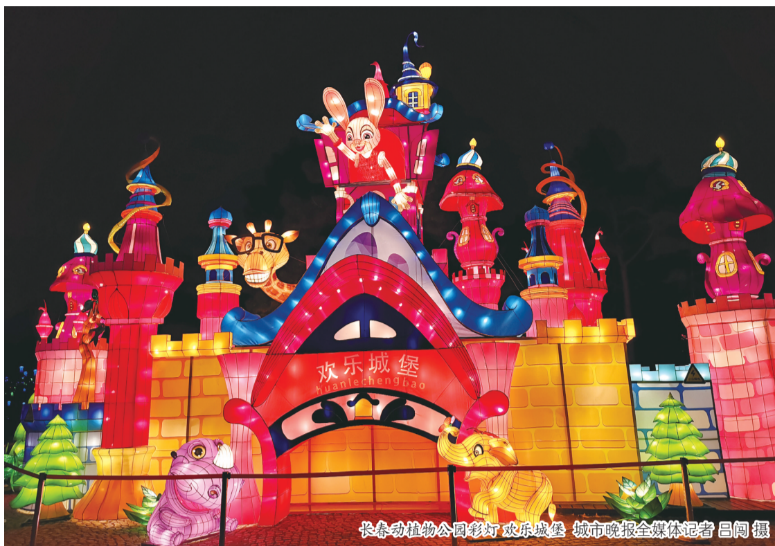
长春动植物公园彩灯 欢乐城堡