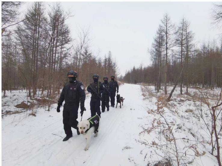
驯导员和警犬“黑壮”开展边境巡逻

“坐、立、袭……”口令一下,一道白色“闪电”突然蹿出,朝着“目标物”进行搜索,这就是警犬“黑壮”,现服役于延边边境管理支队马川子边境检查站。日前,它被国家移民管理局评定为首批“功勋犬”,也是我省移民管理系统的首只“功勋犬”。