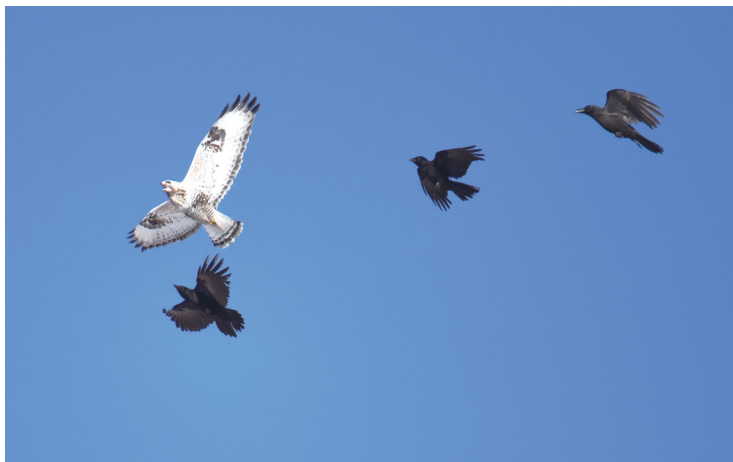
毛脚鹫撤退,乌鸦紧追不舍

毛脚鹫是十足的肉食猛禽,属于国家二级保护动物,有“空中豹子”的美称,它锋利的喙和刚劲有利的双爪是天生的武器。乌鸦如果与它正面交锋显然不是对手。但乌鸦的智商很高,充分利用身体小移动快的特点,采取“围追堵截、上下夹击、佯攻主攻”各种战术,毛脚鹫从始至终都被几只乌鸦纠缠住,每当它攻击其中一只乌鸦时,另几只就