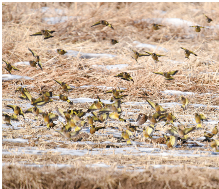
金翅雀在田地里觅食

2月8日上午,省公安厅森林公安局天桥岭森林公安分局民警在巡护途中,发现上百只成群结队的金翅雀,这些鸟儿有时在稻田里觅食嬉戏,有时聚集在电线上,叽叽喳喳鸣叫,热闹非凡,犹如唱响大自然迎春曲。