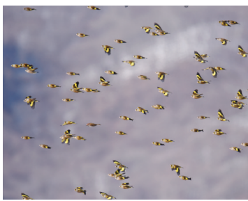
金翅雀在空中飞行

景象。随着生态环境越来越好,保护力度和打击力度不断加大,群众的保护意识进一步增强,伤害鸟类的现象很少发生。销声匿迹的金翅雀前来安家落户,其它越来越多的鸟类也纷纷来此栖息,鸟鸣四野已成为当地一道生态美景。