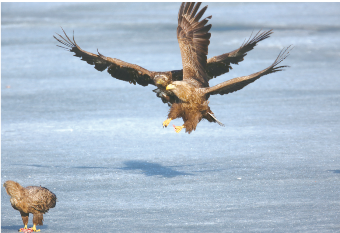
白尾海雕

连日来,虎头海雕、白尾海雕和秃鹫等候鸟如约而至来到珲春敬信湿地,再度吸引全国各地的摄影爱好者来此观鸟、赏鸟、拍鸟。