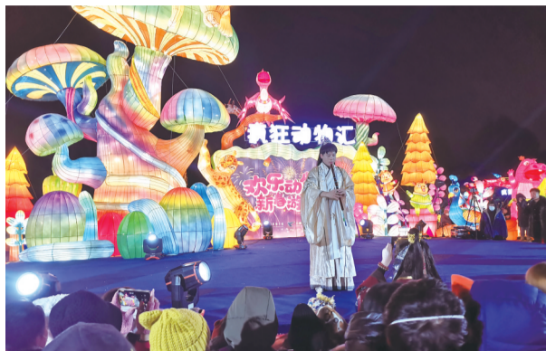
主题灯会节目表演

长春动植物公园主题灯会自开幕以来,备受广大市民、游客喜爱,荣获首届“长春十大冰雪欢乐地”称号。而公园最近也发布消息,夜游动物园项目将持续长期推进。