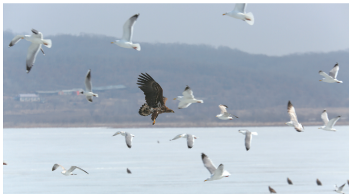
白尾海雕和海鸥在空中翱翔