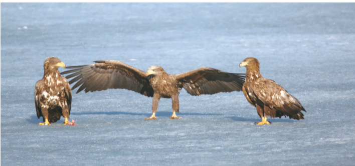
白尾海雕在湖面上闲庭信步