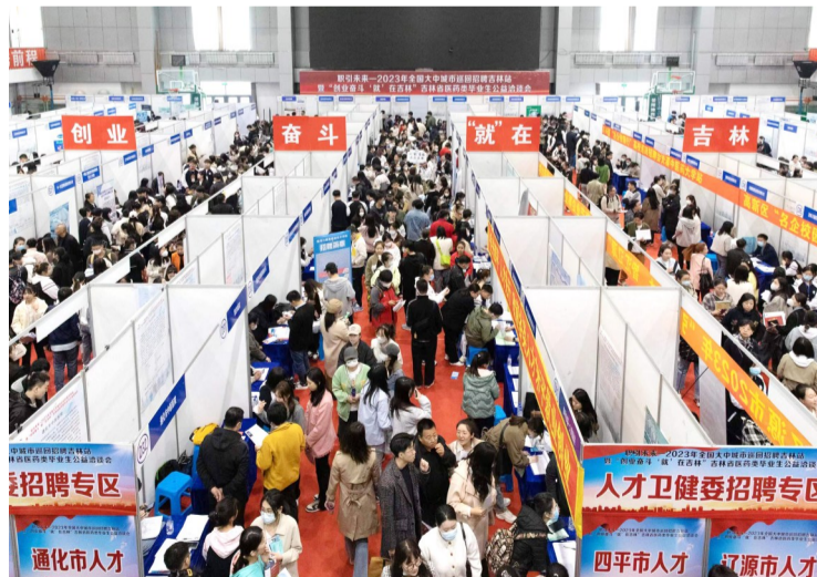
公益洽谈会现场

本次活动招聘企业提供的岗位薪资待遇普遍较高。此外,长春市卫健委发布了2023年“强医计划”,将带领辖区10家医疗单位现场招聘,针对吉林大学、长春中医药大学和延边大学毕业生现场面试考试,合格后落编。