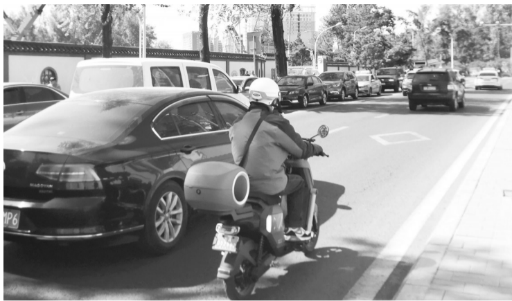
一辆电动自行车已上牌

新政策实施一周多,记者在延安大街、南湖大路、红旗街等路段踏查发现,街头不少电动自行车已完成登记上牌。“直接去现场就可以上牌,整个流程很快,很方便。”市民徐先生是一家饭点的采购员,他刚给两个月前购买的电动自行车登记上牌,他表示,只要手续合规,办理牌照很便捷。但仍有部分市民、外卖员车辆未上牌。一位阿姨直言,以前买的电动自行车没有脚踏板,不符合国标,“好像不能上牌”,准备换个符合国标的电动自