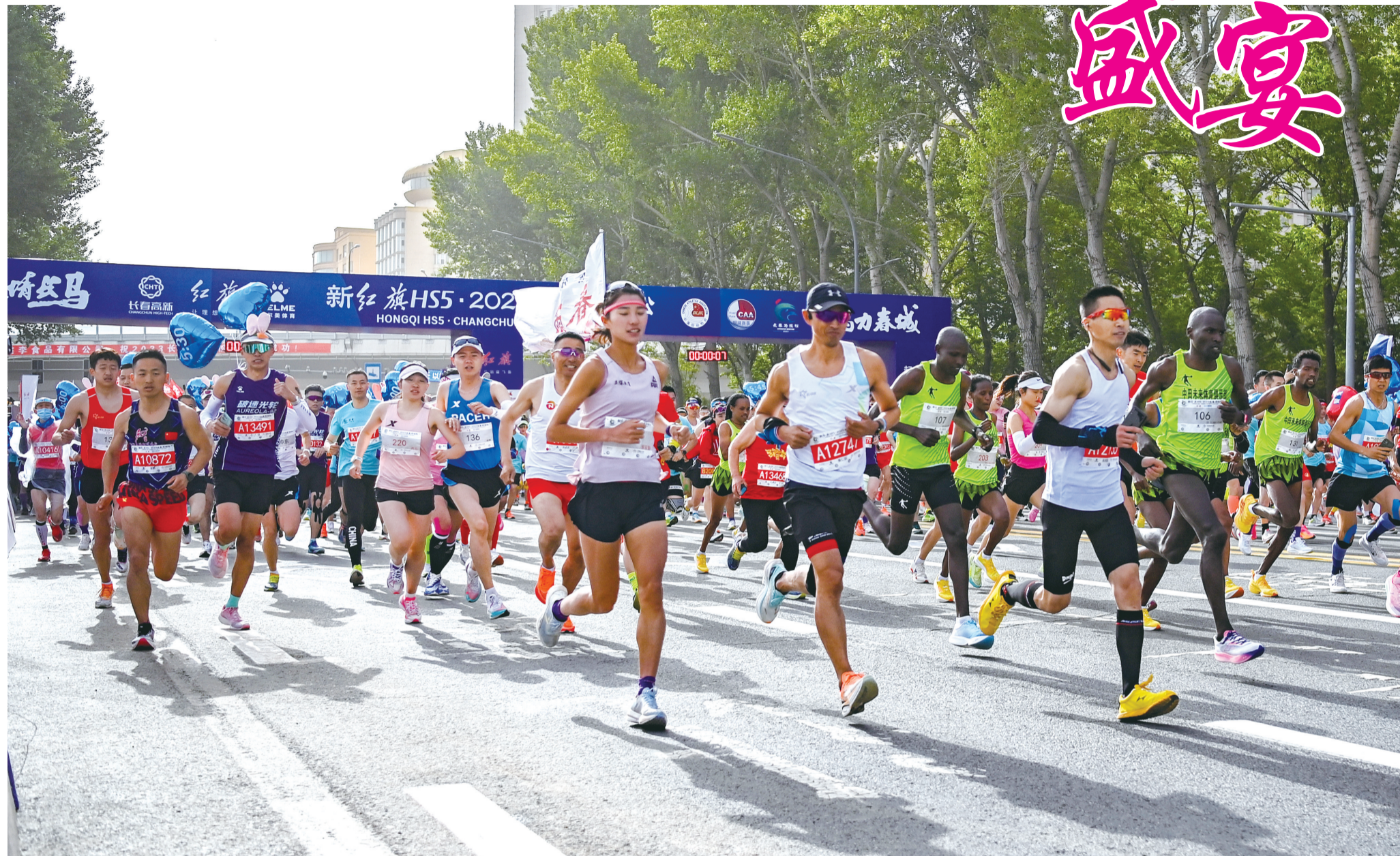
5月21日,参赛选手从起点出发。