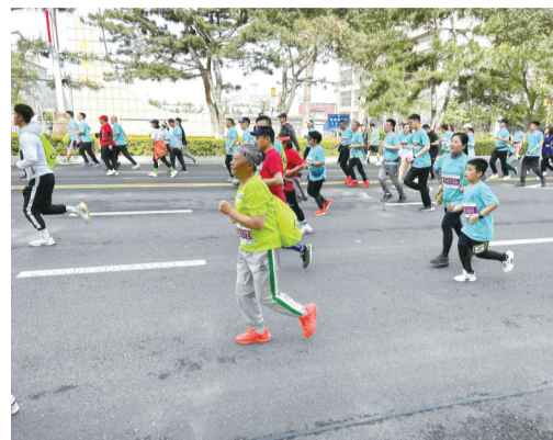
奔跑行列中的白发老人

21日上午,新红旗HS5·2023长春马拉松鸣枪开跑,比赛设全程马拉松、半程马拉松和7.5公里健康跑3个项目,约3万名跑友齐聚春城,用激情、汗水和奋进的脚步唱响振兴时代的最强音。