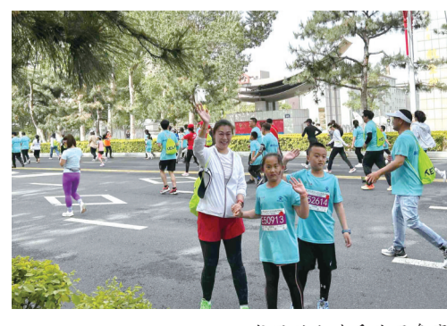
龙凤胎小选手共同参赛