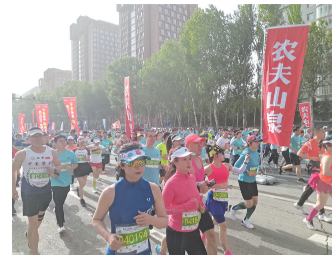
奔跑的队伍中充满了欢乐的气氛