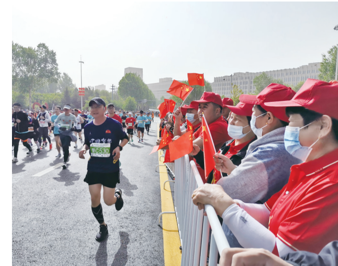
观众们为选手摇旗呐喊