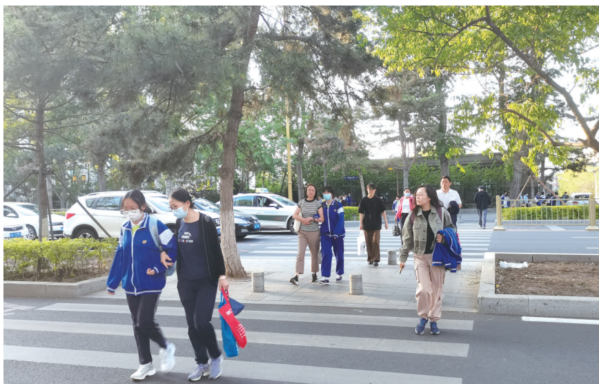
此处人行斑马线将被清除掉

“这里的人行斑马线清除了好事儿,附近学校的学生过街更安全,解放大路的通行能力也会增强!”长春市民王先生表示。