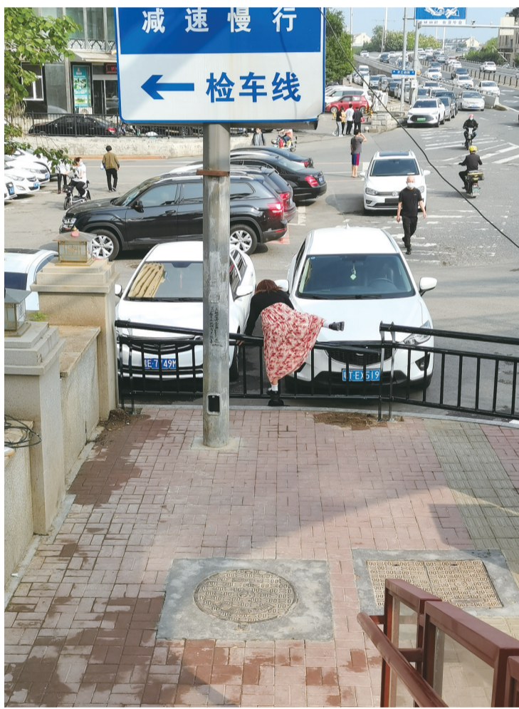
跨越护栏

带着儿子去上学,见护栏挡住去路后,“聪明”的儿子从护栏的间隙中钻了过去,母亲见儿子已经钻过护栏,为防止儿子有危险,“急中生智”直接跨越了护栏。还有很多从天桥上下来的市民,见前方有护栏,有的从原路返回绕一大圈儿走,有的则是从旁边的缓台上跳进附近停车场后绕行,有的则从护栏上直接跨了过去。