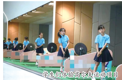
学生们体验高尔夫运动项目