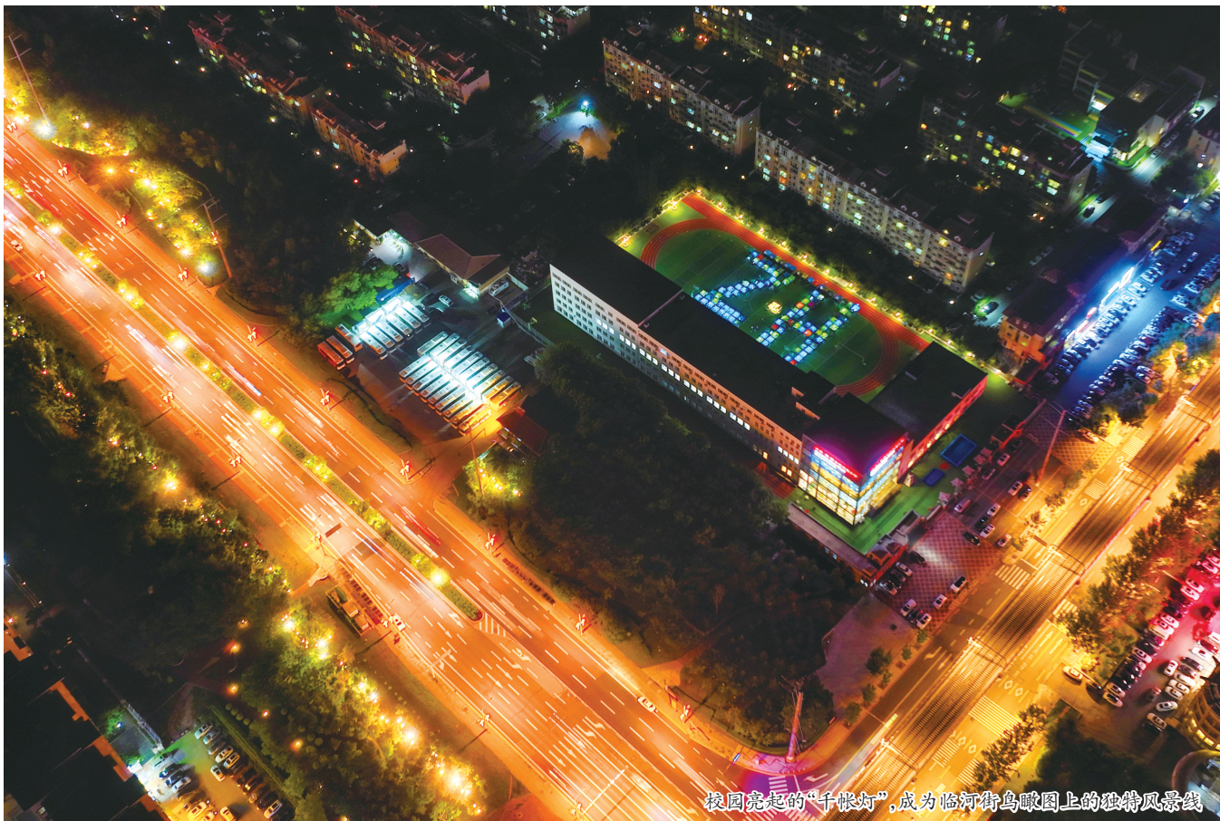
校园亮起的“千帐灯”，成为临河街鸟瞰图上的独特风景线