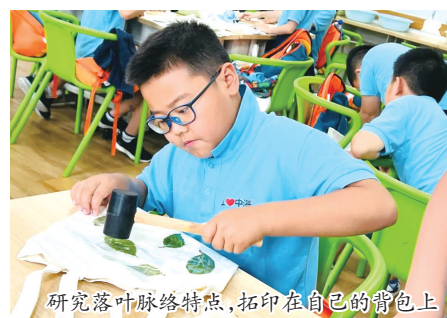
研究落叶脉络特点，拓印在自己的背上