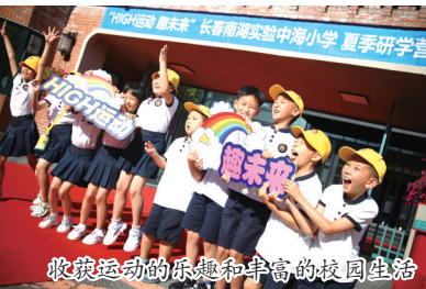
收获运动的乐趣和丰富的校园生活

12日一早，长春南湖实验中海小学门口锣鼓喧天，校门前的空地铺上了大红地毯，一直延伸至教学楼内，孩子们拎着卡通行李在门口的签名墙上签下自己的名字，带着爸爸妈妈抚摸学校从英国运输来的小矮马。学校老师在校门口为学生举行了热闹而隆重的欢迎仪式，等待孩子们的是三天两夜十余项的运动挑战，以及学校独创的校园帐篷营体验。