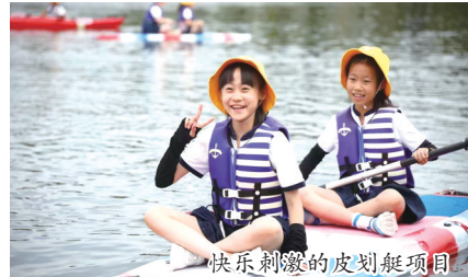
快乐刺激的皮划艇项目