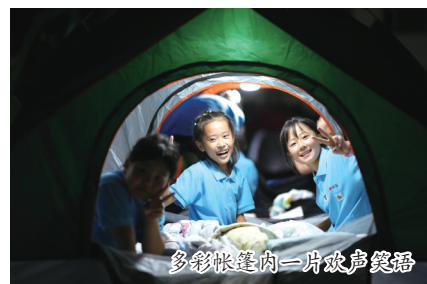
多彩帐篷内一片欢声笑语