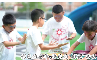
彩色的童年，快乐的“彩跑”活动