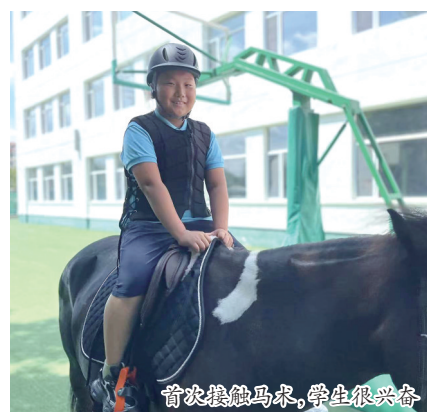
首次接触马术，学生很兴奋