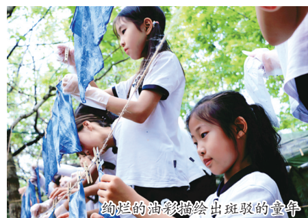
绚烂的油彩描绘出斑斓的童年