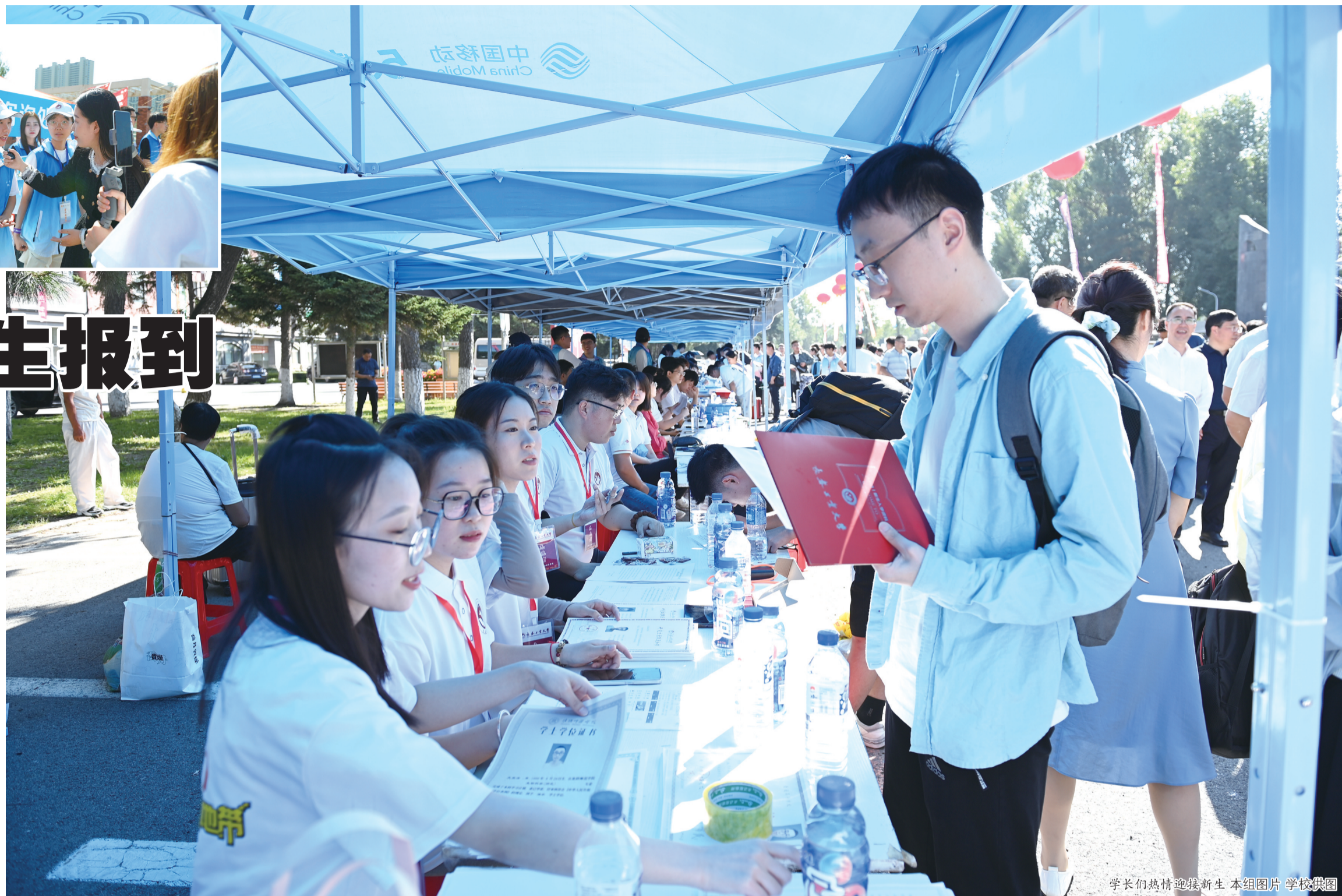
学长们热情迎接新生

9月2日,长春工业大学2023级新生报到,校园欢声笑语,生机勃勃,随处可见的指示牌、条幅和展板,井然有序的迎新站点,热情洋溢的老师和志愿者们,都在用行动告诉每一位新生:“工大欢迎你!” 学校党委书记孙长智、校长张明耀等校领导来到南湖、北湖校区,在迎新现场与前来报到的2023级新生亲切交流,向他们表示热烈欢迎,并慰问现场工作人员与志愿者。 专车接送,全程无忧,护送新生平安抵达,只为让新生便捷、顺利地报到。各学院精心准备了形式多样的打卡活动,新生们纷纷驻足合影。志愿者们笑容是校园最美的风景线。旅途的劳累,远行的辛苦,在阵阵饭香中得到慰藉。在工大食堂里,家的味道永远不变。 踏入校门,我们便多了一个新名字“工大人”,这里是我们的“家”。是未来希望筑基的地方,是我们口中说出的荣耀。 张亮亮 城市晚报全媒体记者 刘昶