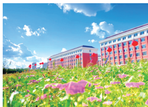
迎新气球将校园衬托得更加美丽