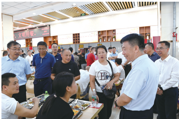
学校领导看望在食堂就餐的新生和家长