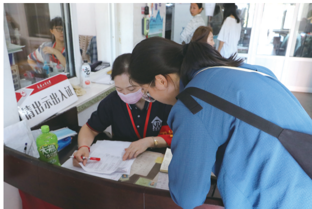
入校登记 志愿者接受采访