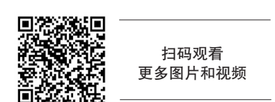
扫码观看更多图片和视频

“迎着灿烂的阳光,走在新时代的... 这首歌唱出了学校、师长对青年一代的殷切希望和激励,希望广大青年担当起党和人民赋予的历史重任,不懈奋斗,用个人鲜活的青春梦想,汇成国家富强、民族复兴和人民幸福的宏伟蓝图,书写奋斗青春的主旋律。” 一代青年有一代青年的际遇,一代青年有一代青年的使命。一百多年来,在中国共产党的旗帜下,一代代中国青年把青春奋斗融入党和人民事业,成为实现中华民族伟大复兴的先锋力量。今天,实现中华民族伟大复兴的历史接力棒已经交到了新一代青年的手中,新时代中国青年生逢其时,重任在肩,他们必将不负所托。“担起历史的重任,挺起民族脊梁,祖国的未来,明天的希望,为新的时代贡献力量……” 新时代的大学生们,让我们一起唱响《青春绽放》,唱响这一首激昂向上的新时代青春之歌,一起厚植家国情怀、涵养进取品格,激扬青春,勇挑重担,奋进昂扬,不负时代、不负韶华,让青春在党和人民最需要的地方绽放绚丽之花! 城市晚报全媒体记者 刘昶