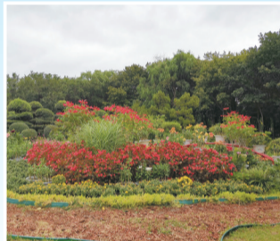
菊花和其他花卉打造成特色景点