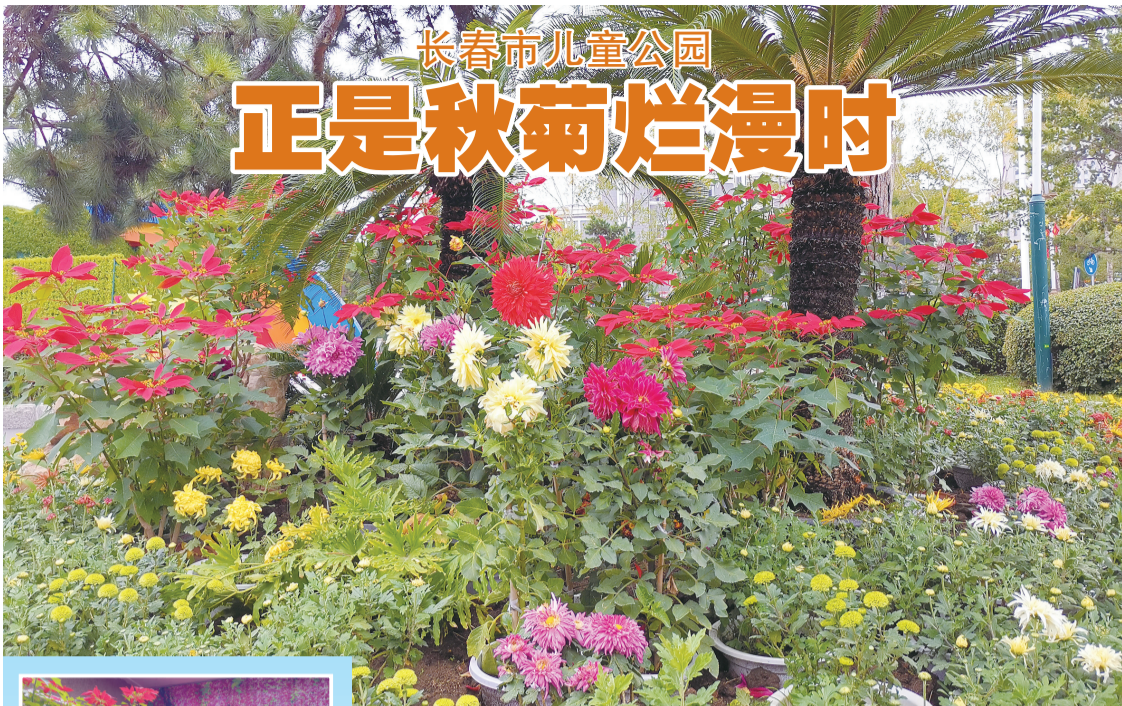
各种菊花绚丽多彩

金秋时节,长春市儿童公园扎实推进园区彩化景观提档升级,借鉴第三届园林微景观大赛设计手法,利用儿童公园菊花种植优势,结合园区现有景观实际,打造精彩纷呈的菊花盛宴。