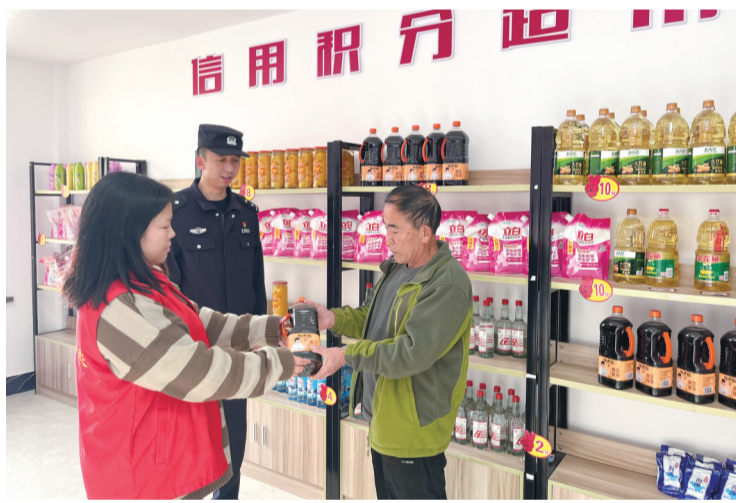
居民用积分兑换物品

名啦,参与活动的可以增加5个积分!”随着望江村的喇叭不断播报,此时警务室门前聚集的村民也越来越多。