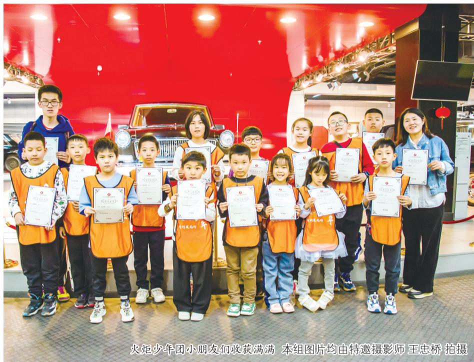
火炬少年团小朋友们收获满满

“我们所在的一汽红旗文化展馆建于2007年，展示了红旗从诞生到成为‘国车’，再到如今强势崛起的发展历程……”4月21日，城市晚报火炬少年团充满活力少年们，走进红旗文化展馆，共同探寻民族汽车工业发展的足迹，感受红旗精神带来的磅礴力量，开启一场长春汽车文化之旅。