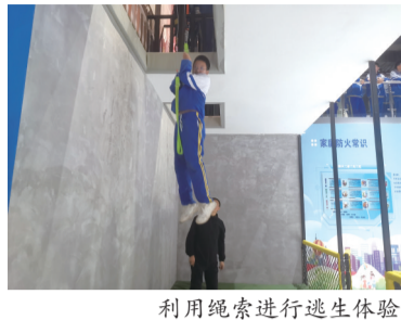
利用绳索进行逃生体验