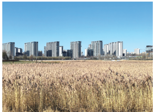
天空湛蓝,芦苇轻拂

深秋,是芦苇花盛开的季节,秋天的专属浪漫,藏在草木繁多处。而长春市同心湖公园,便有着这份秋日限定美景!