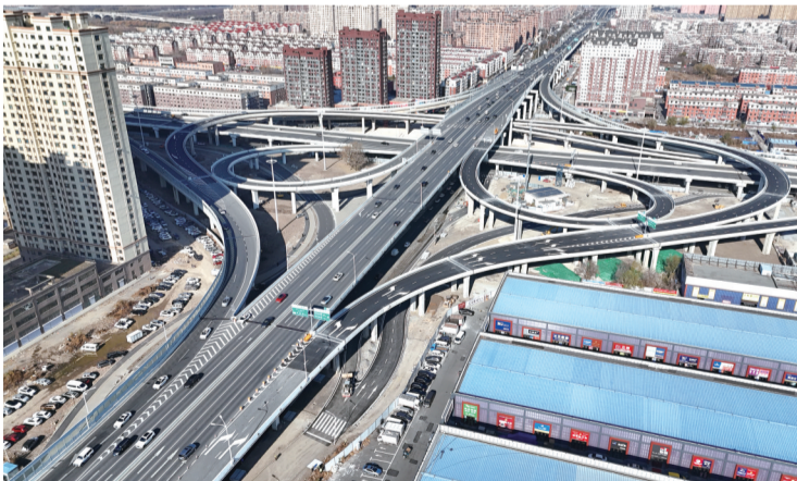
即将通车的互通立交匝道完善工程

2024年7月,影响剩余工程的征拆问题解决后,长春市建委立即重新启动项目建设。由于周边交通流量较大,施工作业面非常有限,既要保证群众正常出行,又要兼顾施工对周边环境的影响,同时考虑整体经济性,市建委科学高效组织,持续保证人员、材料、机械投入,4条匝道全部同期施工,仅用118天就完成了全部匝道及西向南、南向东地面右转道路建设,目前已具备通车条件,于11月8日正式开放交通。