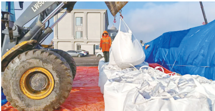
储备充足除雪防滑物资

白城市交通运输部门结合国省干线公路实际,储备充足除雪防滑物资,全力做好冬季除雪保畅工作。截至目前,已储备防滑料1385立方米、融雪剂712吨,准备除雪铲、滚雪刷、融雪剂撒布车、装载机、平地机、自卸车等设备、车辆85台(套),组建应急抢险队伍5支、作业