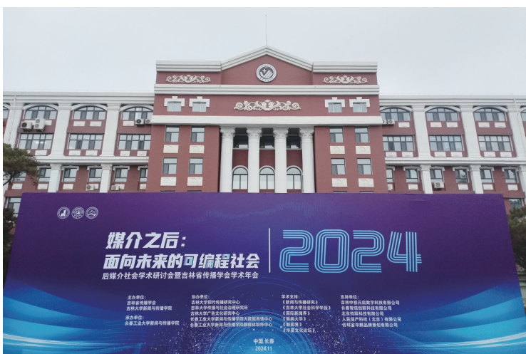
年会主题展板

随后举行的大会主旨发言共分两场进行,会上,省内外专家学者分别以“技术想象与生成性社会”“人工智能与媒介新生态”“地方感知与再媒介化”“媒介基础设施与连接文化”“作为媒介的身体与数据化生存”“不可遗忘之痛与视频化生存批判”“时间地图与东北记忆”“数智传