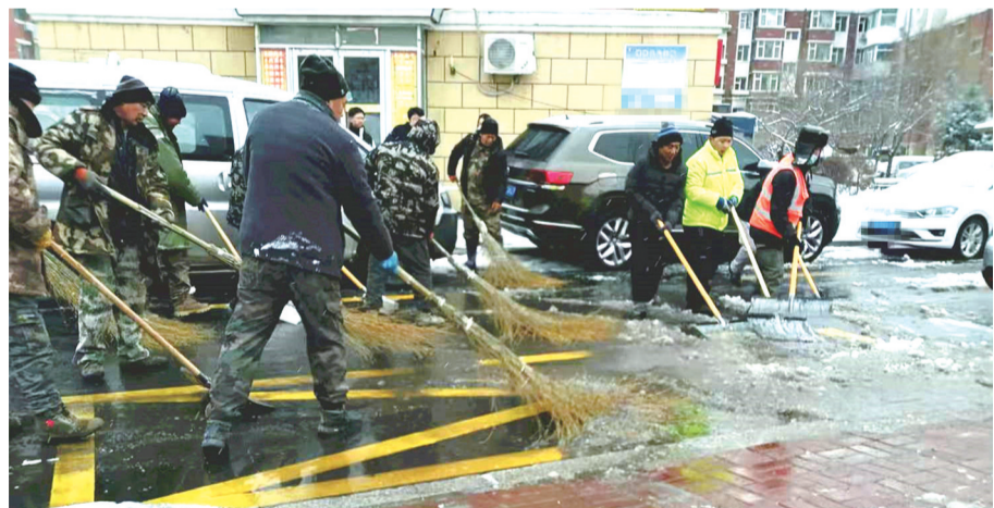
发动社会力量一同清雪

城市的清雪工作,除了主要街路之外,城市的“毛细血管”同样重要。记者了解到,长春市城市管理部门组织街道办事处、沿街单位与环卫队伍同步开展了清雪作业,督促企事业单位、沿街商家和物业小区及时清雪,与专业队伍清雪作业有序衔接,全力保障交通顺畅和市民出行。